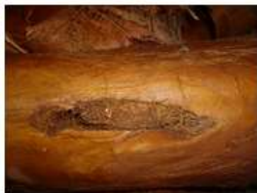
Capullo en 640 Esteward