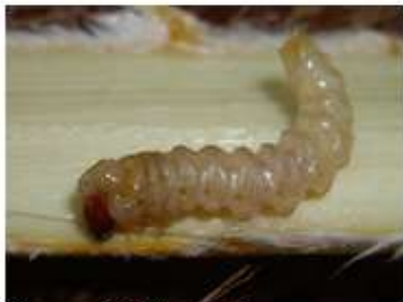
Oruga en 632 Abamectina