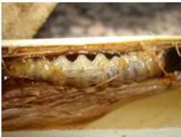
Oruga en 632 Abamectina