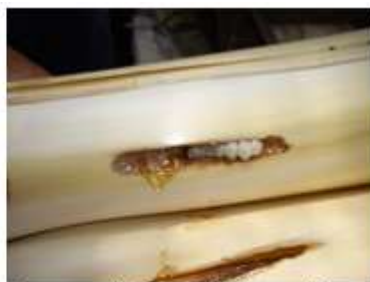
Oruga y galería en 633 Abamectina

Como se vieron algunas mariposas de Paysandisia volando en la parcela, se dio aviso a TRAGSA, para que destruyeran por trituración toda la plantación, para evitar la dispersión de la plaga a parcelas colindantes.