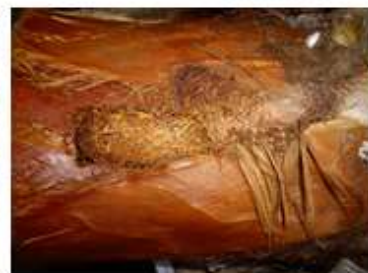
Capullo en 635 testigo