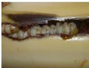
Oruga en 753 testigo