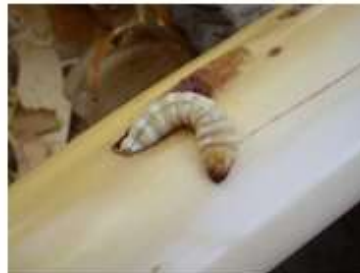
Oruga en 638 Exper