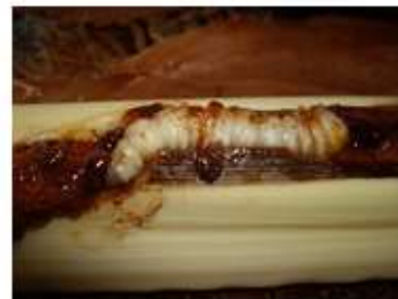
Oruga en 629 Steward