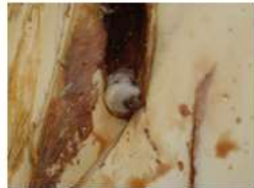
Oruga en 637 Altacor