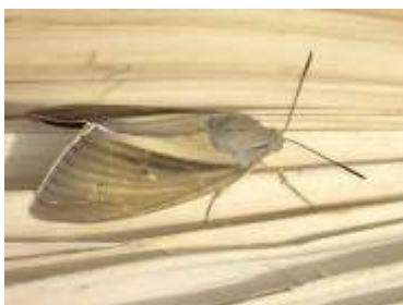
Adulto emergido en la plantación (09-06-2014)