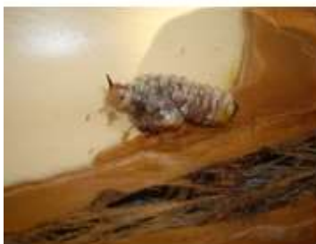
Oruga en 749 Exper