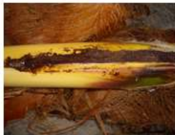
Galería en 746 test