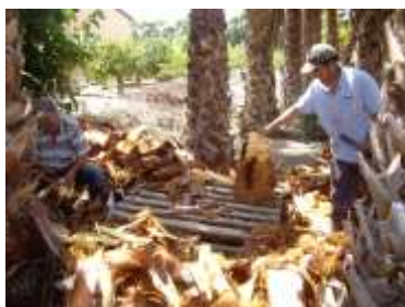
Abertura de palmeras (11-06-2014)

Los resultados se reflejan en el cuadro adjunto.