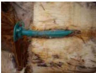
Corte de piqueta colocada