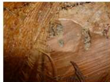
Secreciones Arenipses en 627 Eman