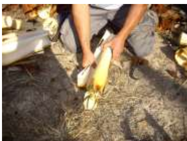
Tejido tierno afectado (09-06-2014)

El día 9 de junio se abrieron las primeras palmeras y el 11 de junio el resto.