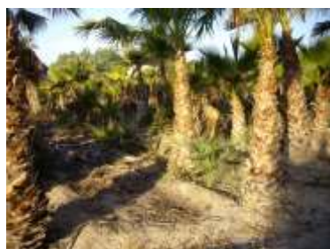
Parcela del ensayo