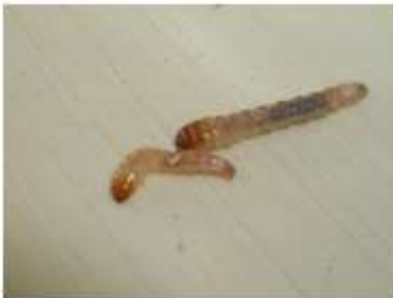
2 orugas de Arenipses en 746 test.