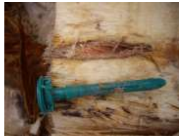
Piqueta y orificio

El segundo tratamiento se hizo el día 4 de abril de 2014