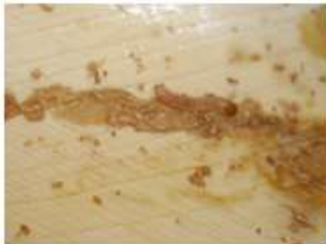
Galerías de Arenipses en 746 testigo