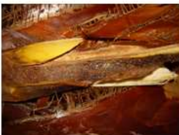
Capullo en 634 Altacor