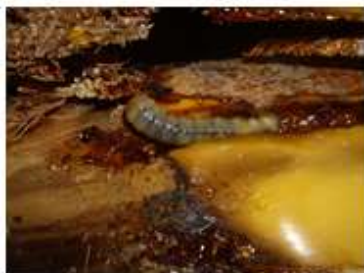
Oruga en 639 Enamectina