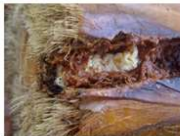
Oruga en 758 testigo