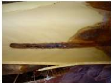
Galería en 636 Emamectina