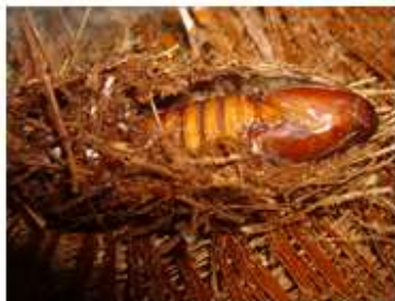
Capullo en 746 test (09-06)

Para este ensayo, los productos que resultaron más eficaces fueron emamectina e indoxacarb (Steward).