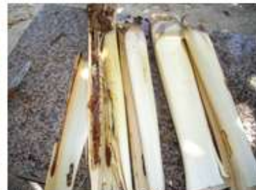
Galería y oruga en 633 Abamectina